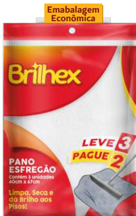
BRK-8609 Panos Esfregão Alvejado L3P2 Paños para Piso Blanqueado con 3 | White Floor Cloth 3 Ct