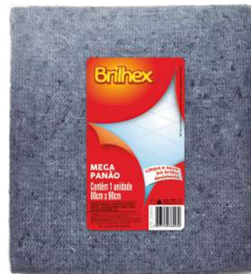
BRK-8093 Mega Panão Azul Mega Paño Azul | Blue Mega Cloth