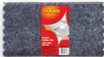
BRK-8088 Pano p/ Pia Unitário Paño Lava Platos | Kitchen Cloth