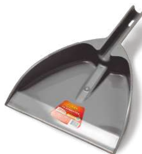
BRK-9353 Pá Doméstica Recogedor Uso Doméstico | Domestic Dustpan