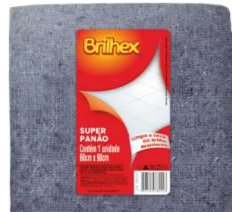
BRK-8092 Super Panão Azul Super Paño Azul | Blue Super Cloth