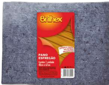
BRK-8090 Pano Esfregão Azul Paño para Piso Azul | Blue Floor Cloth