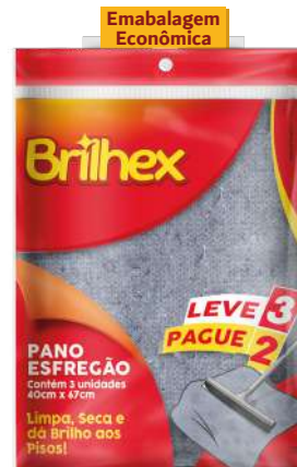
BRK-8091 Panos Esfregão Azul L3P2 Paños para Piso Azul con 3 | Blue Floor Cloth 3 Ct