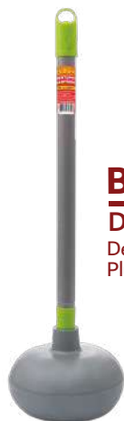
BRK-9350 Desentupidor Sanitário Destapador Sanitario | Toilet Plunger