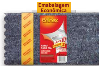
BRK-8089 Panos p/ Pia L3P2 Paños Lava Platos con 3 | Kitchen Cloth 3 Ct