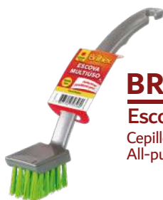
BRK-9348 Escova Multiúso c/ Cabo Cepillo Multiuso con Mango | All-purpose Brush with Handle