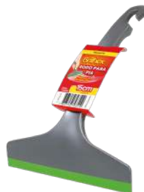
BRK-9351 Rodo para Pia 15 cm Escruidor Lava Platos 15 cm | Sink Squeegee 15 cm