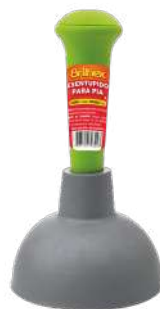
BRK-9349 Desentupidor de Pia Destapador para Lava Platos | Sink Plunger