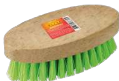
BRK-8382 Escova Multiúso Tradicional Cepillo Multiuso | All-purpose Brush