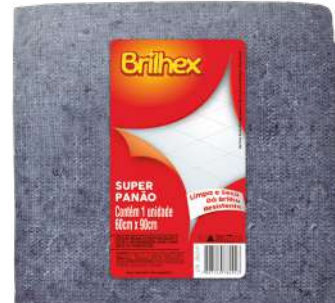
BRK-8092 Super Panão Azul Super Paño Azul | Blue Super Cloth