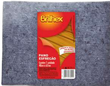
BRK-8090 Pano Esfregão Azul Paño para Piso Azul | Blue Floor Cloth